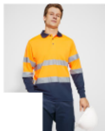
POLARIS L/S HV9306