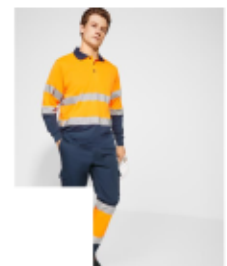
DALY STRETCH HV/HV9312