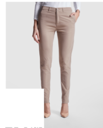
BEVERLY WOMAN PA9146