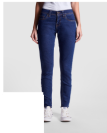
BROCK WOMAN PA8416