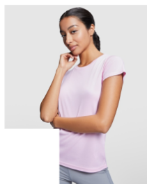
MONTECARLO WOMAN CA0423