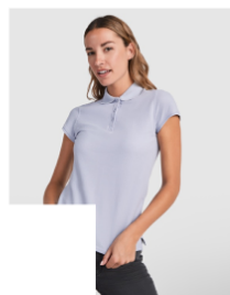
STAR WOMAN PO6634