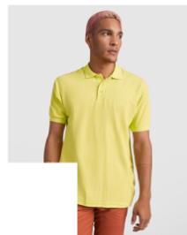
PEGASO PREMIUM PO6609